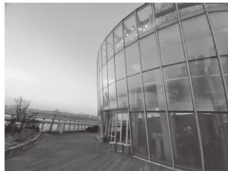
ISPOG2025 の開催が予定されている会場で開催された韓国女性心身医学会時の写真（外観）